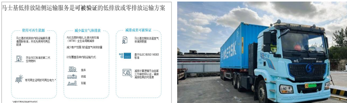
马士基低排放陆侧运输服务是可验证的低排放或零排放运输方案

在正式推出服务前，马士基进行了为期一年多的新能源集卡测试，覆盖不同运输场景和多种能源类型。基于数据与经验搭建了四阶段平台：原始数据收集、碳排核算、环境权益划归、结果可视化交付。核算经国际第三方鉴证，采用 GLEC 与 GHG Protocol 等标准，覆盖全生命周期。与传统化石燃料运输不同，电动集卡完成运输后，平台会收集运输数据并核算碳排，根据实际耗电量匹配等量绿色电力证书，最终向客户交付完整的服务报告。